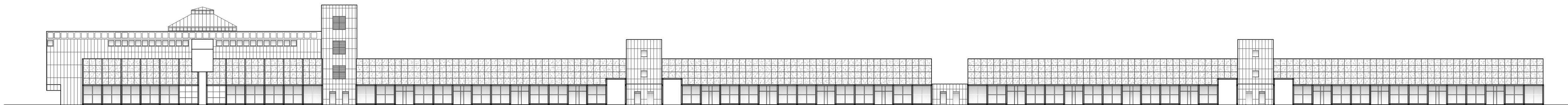
PROSPETTO LATERALE - SUD OVEST UGUALE NORD EST Scala 1:500